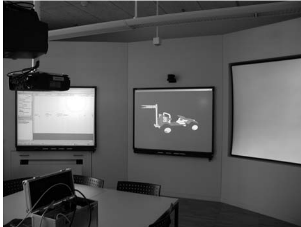
Bild 3. Typischer Setup für eine FMEA-Sitzung.

Eine alternative Lösung sieht vor, zwei Computer über ein Netzwerk miteinander zu verknüpfen. Bei dieser Client-/Server-Lösung kann der Client, auf dem die FMEA-Software läuft, den Visualisierungsrechner fernsteuern. Somit ist es möglich, von einem zweiten Laptop bis hin zu einem Visualisierungsrechner die lokal vorhandene Hardware zu nutzen. In beiden Fällen werden an die Ausgänge der Graphikkarten zwei Beamer angeschlossen, so dass ein Bild in der geforderten Grösse möglich wird.