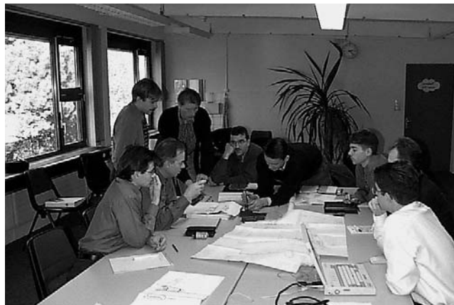
Bild 1. Schwierig zu moderierende FMEA-Sitzung.

Idealerweise sollte eine FMEA von einem interdisziplinären Team durchgeführt werden. Dies hat zur Folge, dass nicht notwendigerweise alle Teilnehmer die vorhandenen Informationen gleich gut verstehen können, beispielsweise bei 2D-CAD-Zeichnungen oder bei FEM-Berechnungsergebnissen. Auch eventuell vorhandene 3D-Modelle oder Teile sind häufig nur einmal vorhanden und können somit nicht dem gesamten Team gleichzeitig visualisiert werden. Zeichnungen vermitteln immer nur eine Ansicht und können nicht nach Belieben verändert oder gedreht werden. Dies hat zur Folge, dass nicht immer alle Teilnehmer an der Sitzung aktiv teilnehmen können.